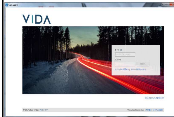
アプリケーション起動後の画面